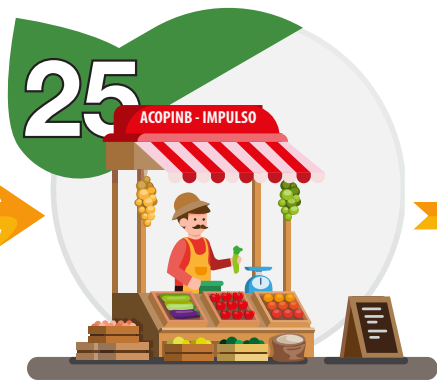
Mercadillos Ecosolidarios en los que hemos participado aportando nuestros productos ecosolidarios