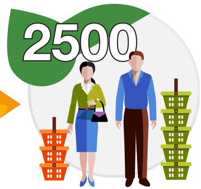
Nº de Personas que han visitado nuestros Mercadillos Ecosolidarios y han adquirido nuestros productos.