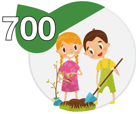
Niños y niñas de Córdoba que visitan nuestra Agroescuela Ecológica y realizan talleres de Educación Ambiental Inclusiva

La Misión, Visión y los valores de nuestra Asociación tienen como finalidad generar cambios positivos, ya sean a nivel social como medioambiental. A continuación mostramos un leve esquema de los impactos que la Asociación ha creado este año en Córdoba con sus actuaciones.