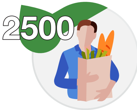
Bolsas Ecológicas que han ayudado a reducir el consumo de plásticos